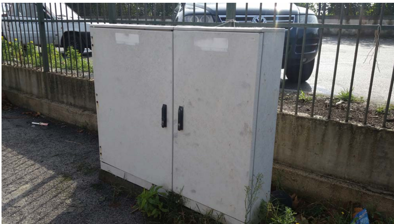
Fotografia 06 – Quadri elettrici