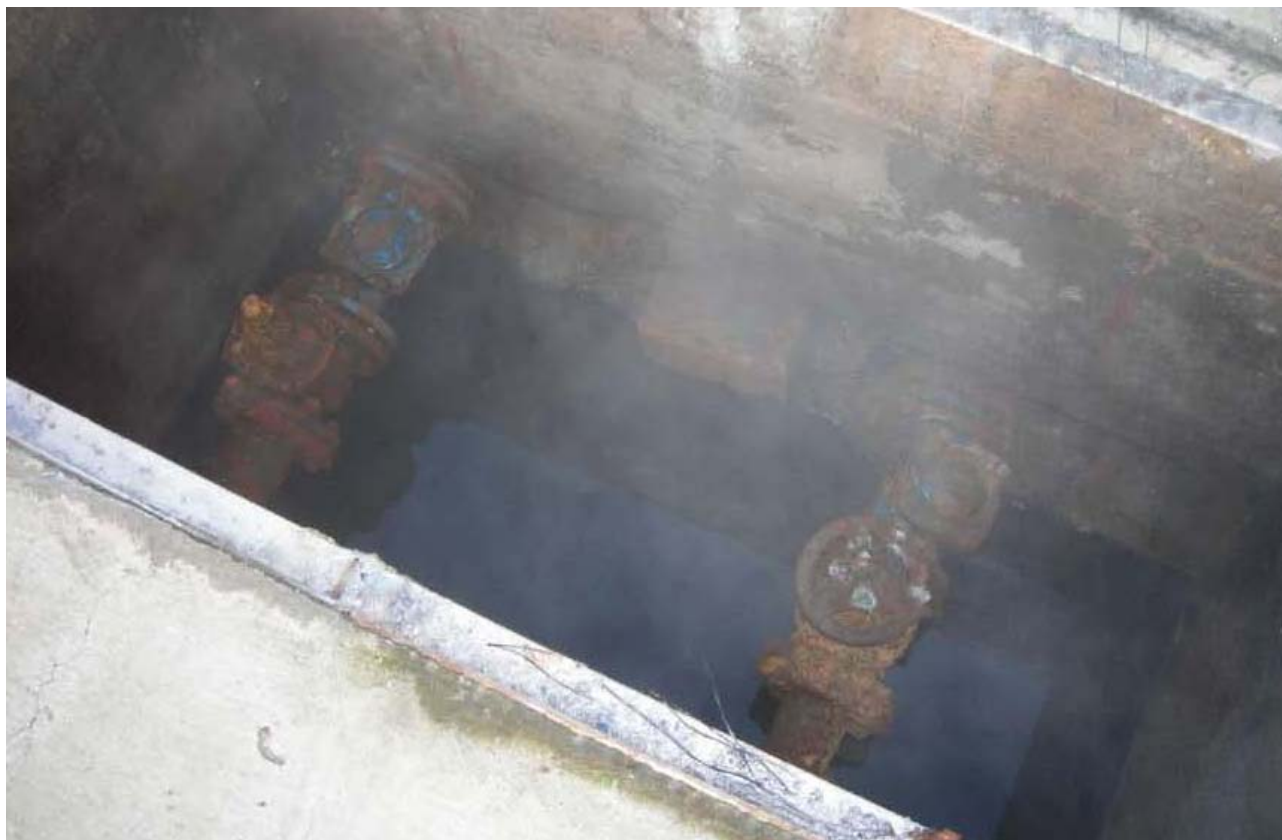
Fotografia 05 – Camera di manovra