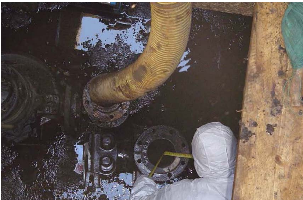
Fotografia 03 – Vasca alloggiamento elettropompe