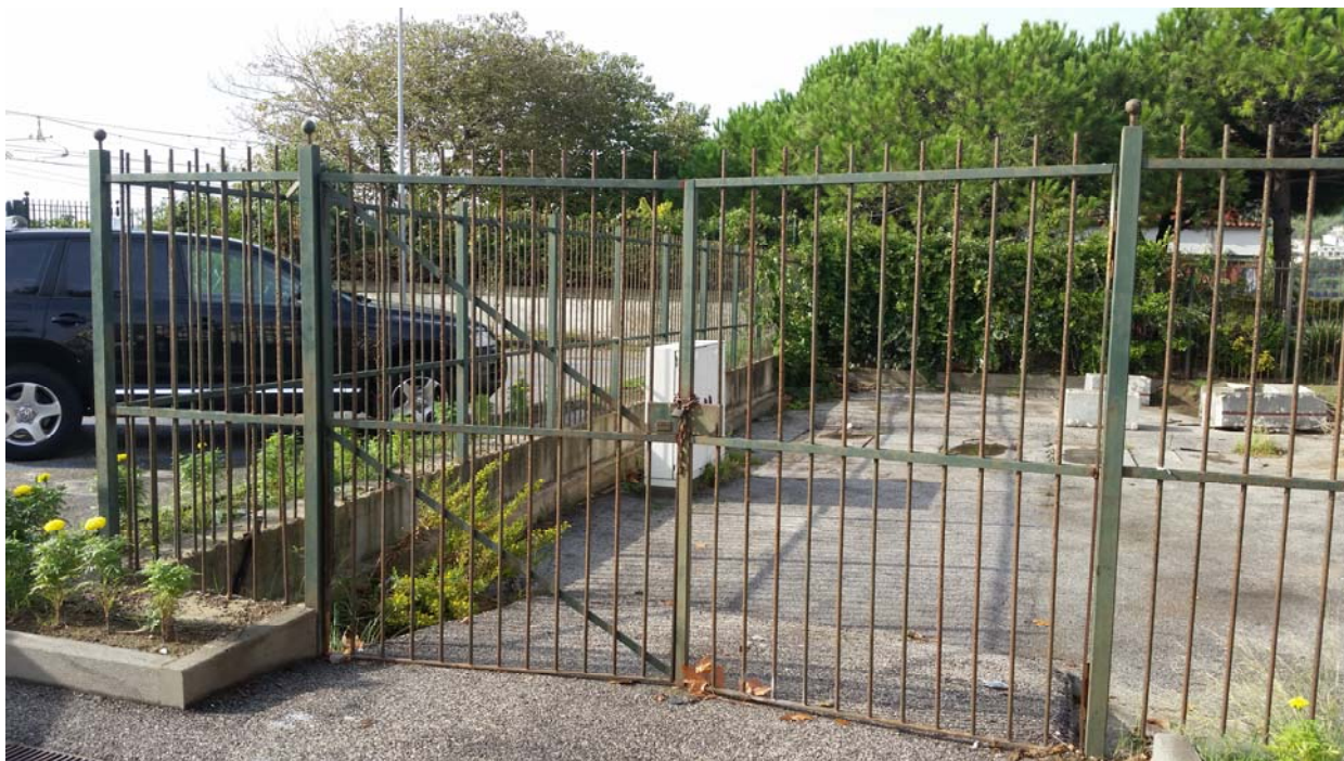
Fotografia 01 – Vista esterna

Nel presente paragrafo si riportano alcune fotografie relative all'impianto nei punti più significativi dell'impianto di sollevamento di Lucrino Piscina .