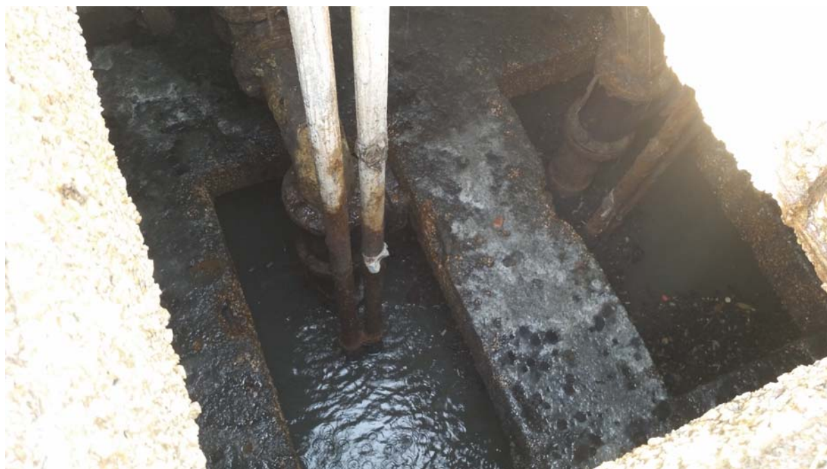
Fotografia 02 – Vasca alloggiamento delle elettropompe