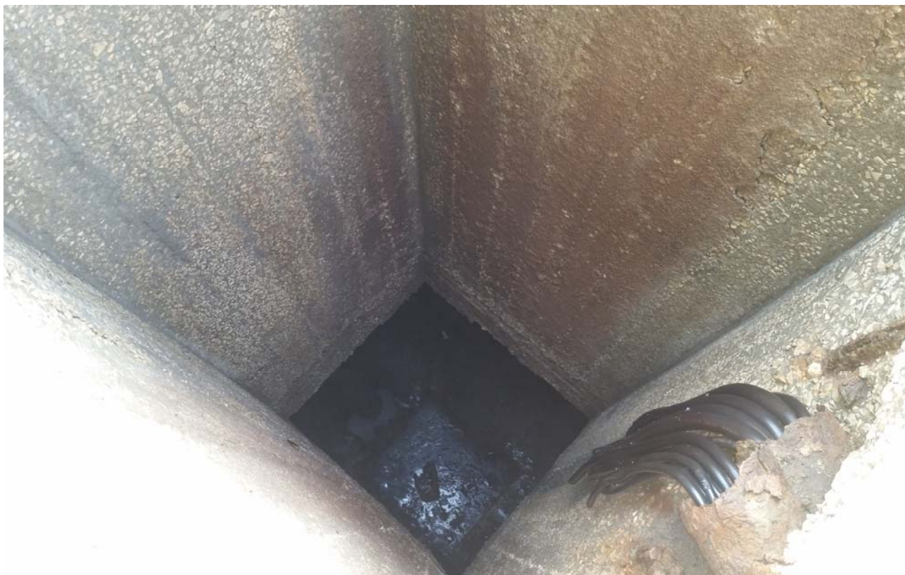
Fotografia 03 – Vasca alloggiamento elettropompe