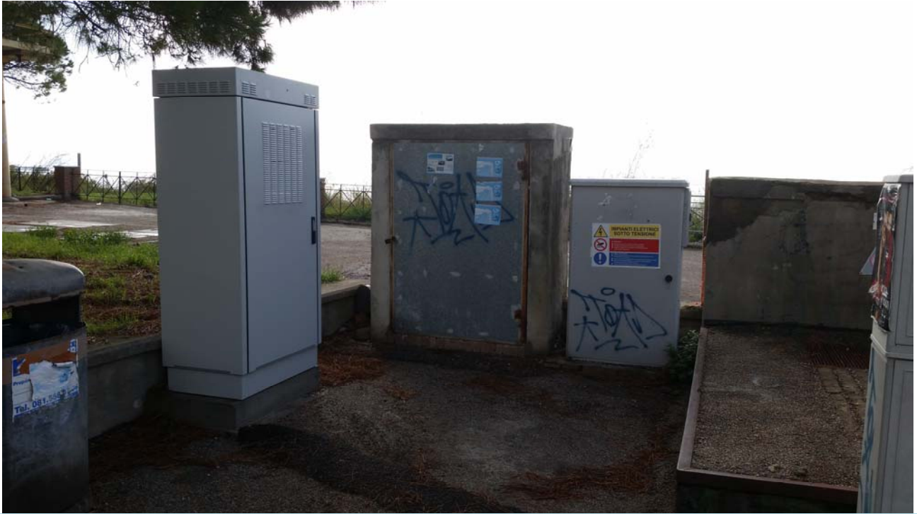
Fotografia 01 – Vista esterna

Nel presente paragrafo si riportano alcune fotografie relative all'impianto nei punti più significativi dell'impianto di sollevamento di Lucrino Tripergola .