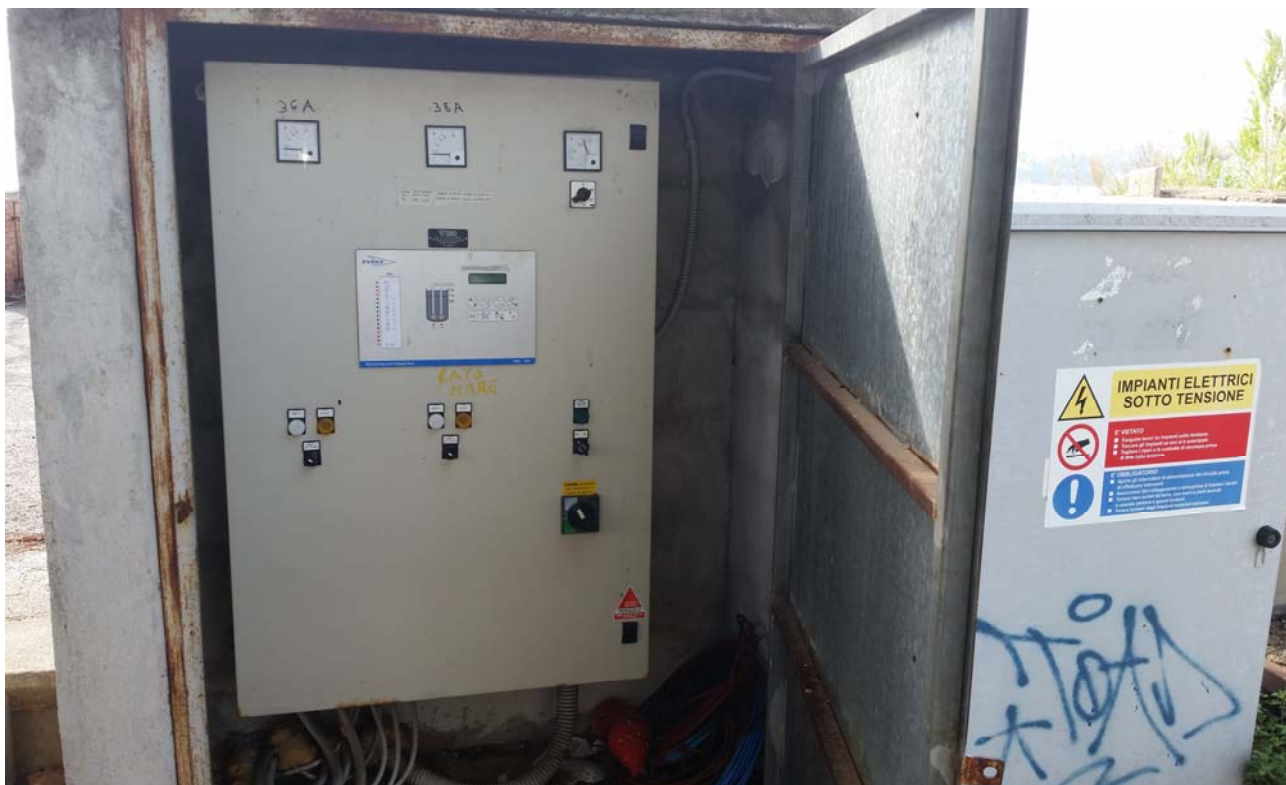
Fotografia 06 – Quadri elettrici