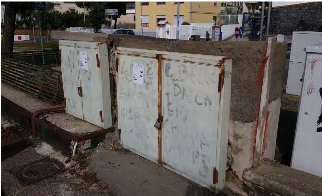
Fotografia 05 – Vista esterna dei quadri elettrici