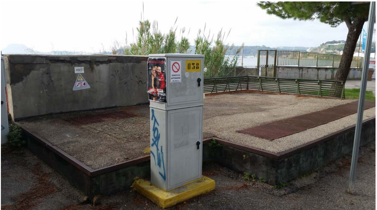
Fotografia 02 – Vista esterna