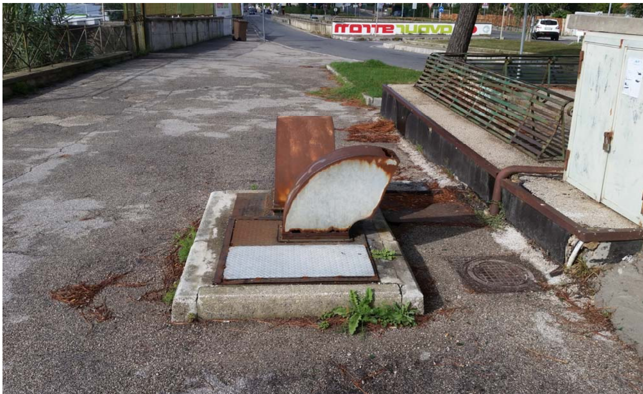
Fotografia 04 – Vista esterna del gruppo elettrogeno