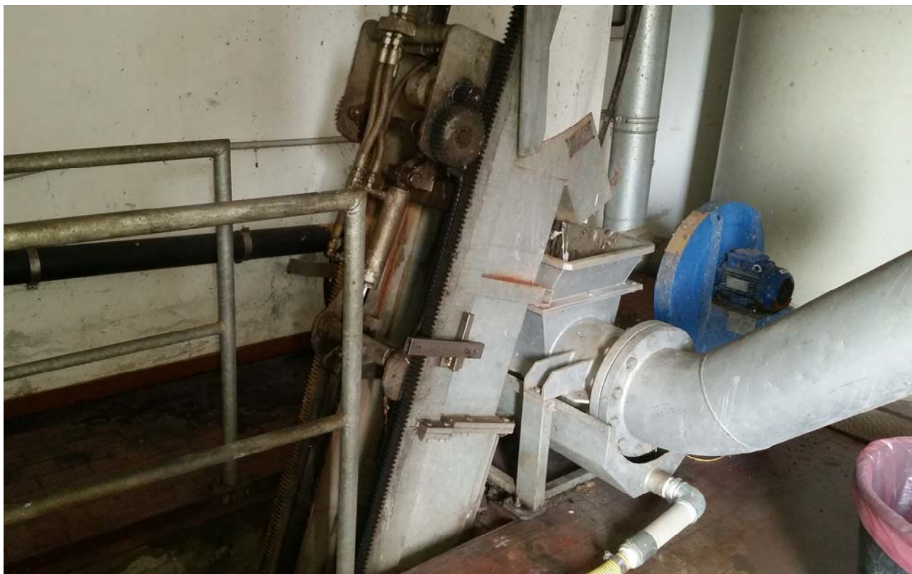
Fotografia 03 – Vista dello sgrigliatore