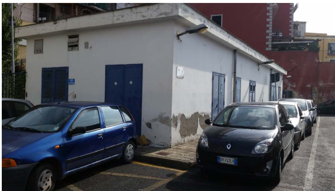
Fotografia 01 – Vista esterna

Nel presente paragrafo si riportano alcune fotografie relative all'impianto nei punti più significativi dell'impianto di sollevamento di Mercato Ittico .