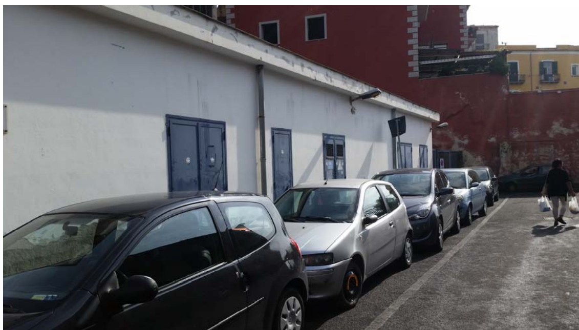
Fotografia 02 – Vista esterna