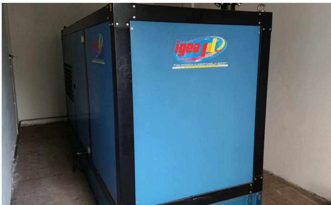
Fotografia 08 – Gruppo elettrogeno