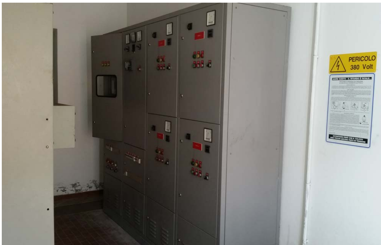
Fotografia 07 – Misuratore Enel e quadri elettrici