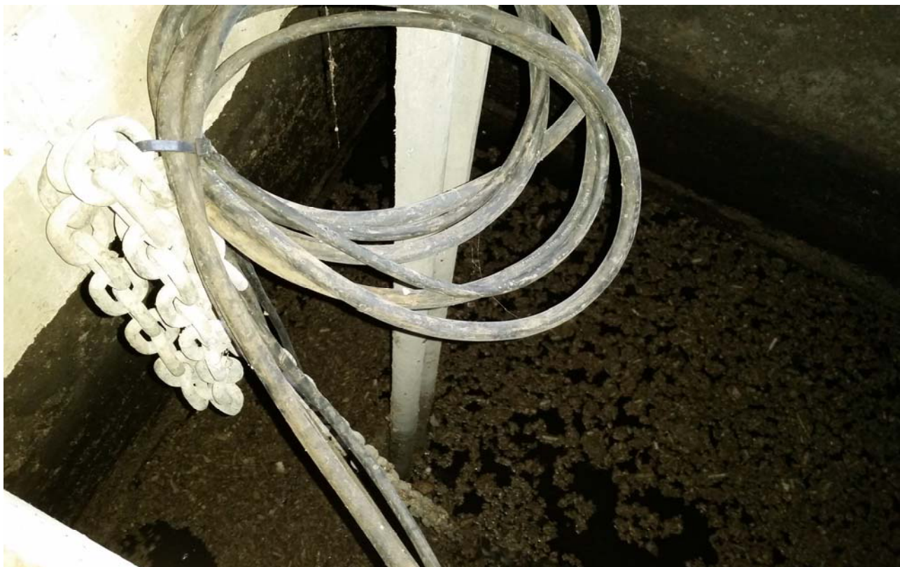
Fotografia 05 – Vasca con alloggiamento delle pompe