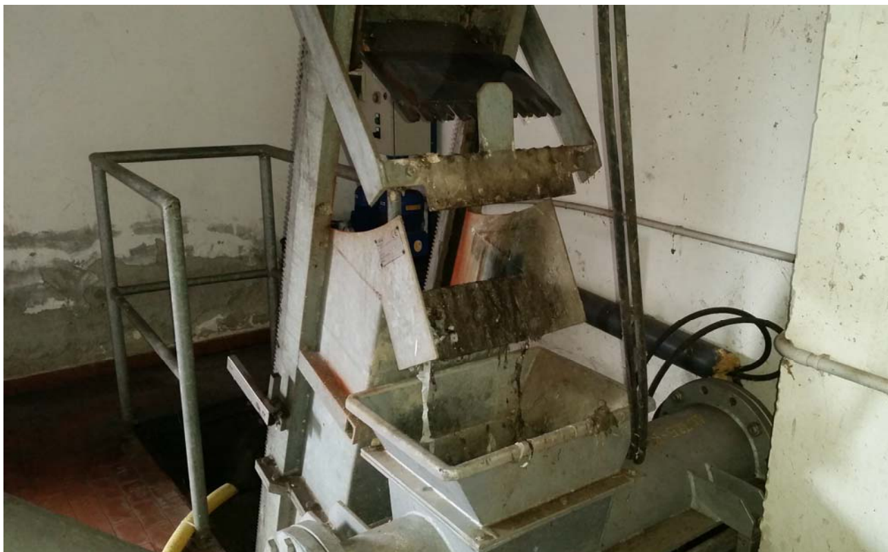
Fotografia 04 – Vista dello sgrigliatore