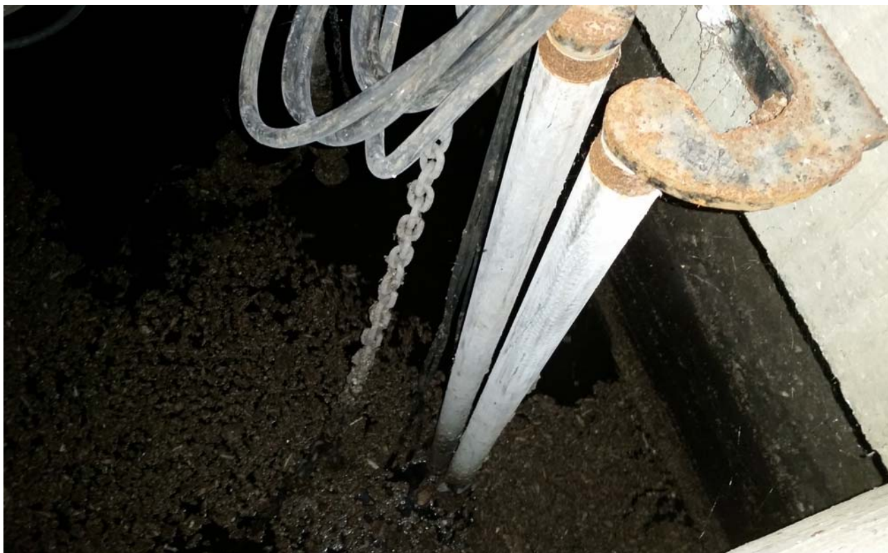
Fotografia 06 – Vasca con alloggiamento delle pompe