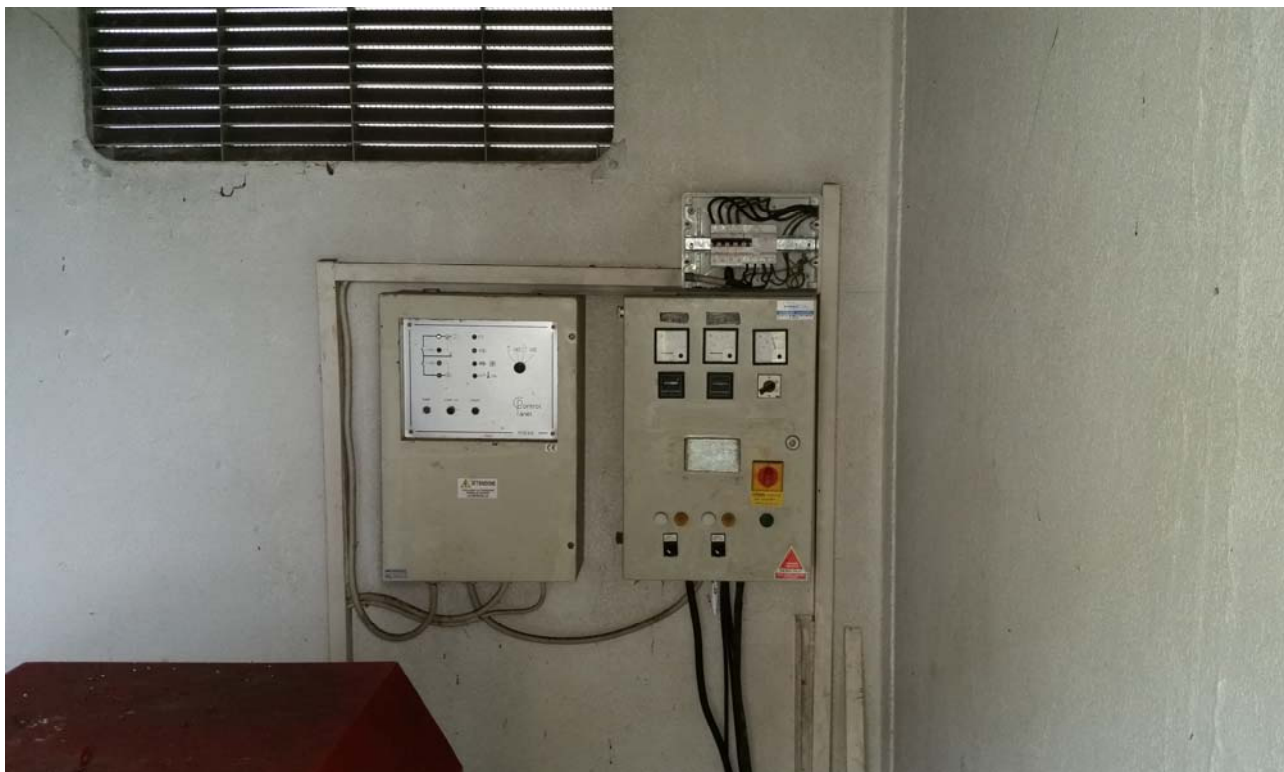
Fotografia 05 – Misuratore Enel e quadri elettrici