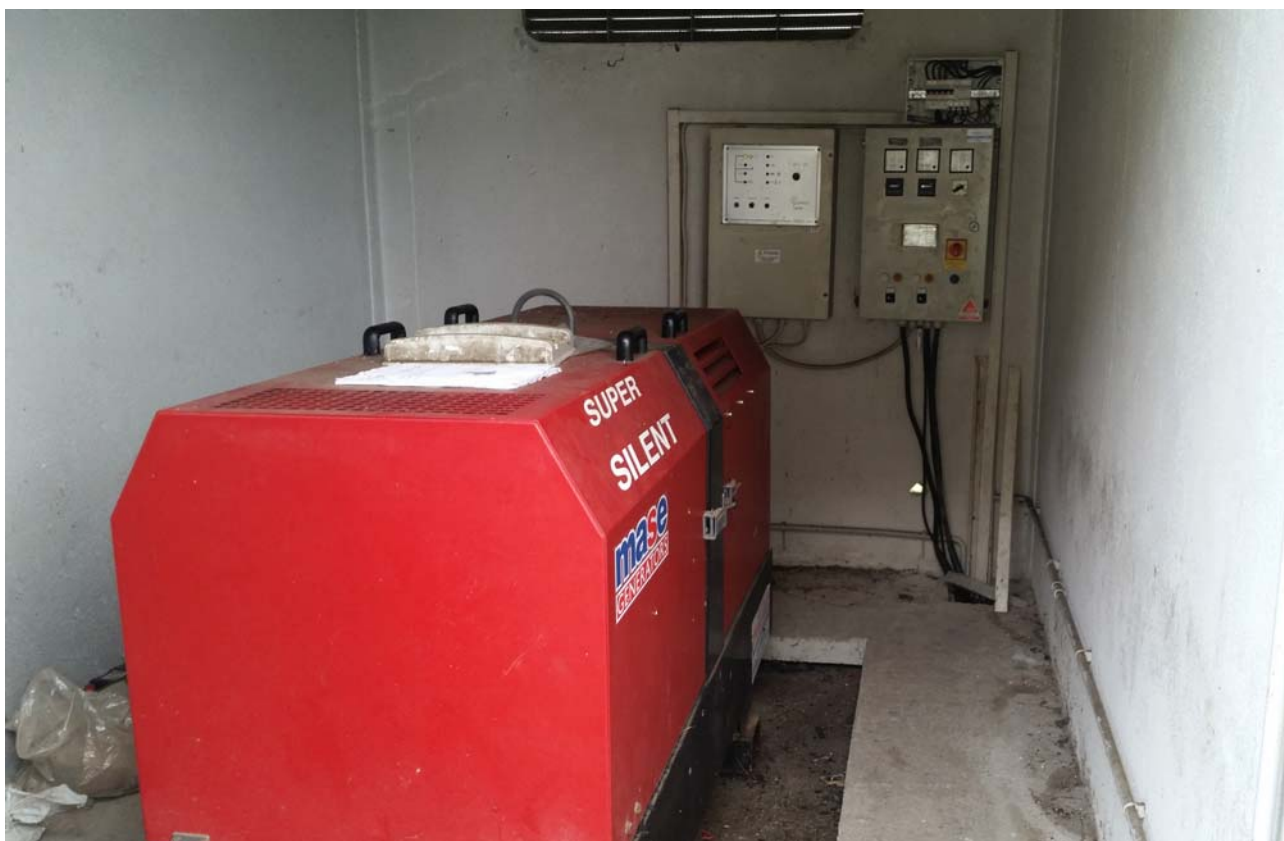
Fotografia 06 – Gruppo elettrogeno di sicurezza