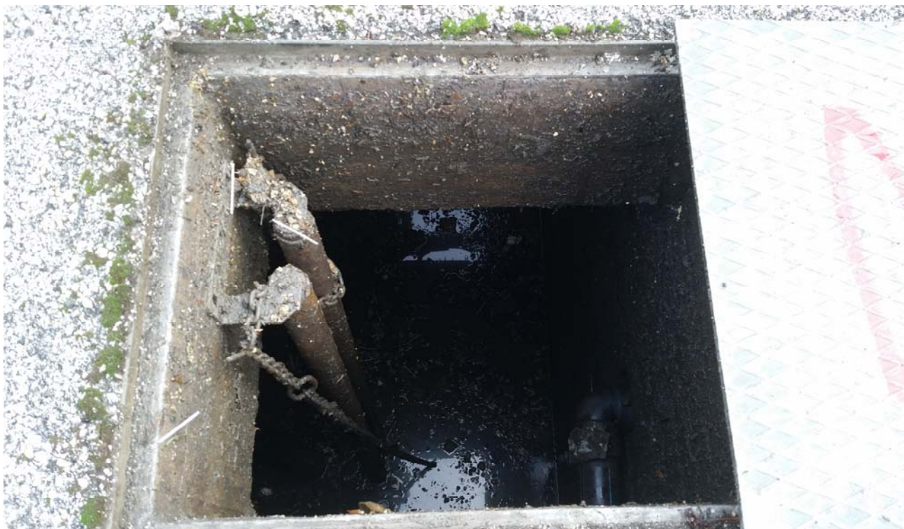
Fotografia 03 – Vasca alloggiamento elettropompe