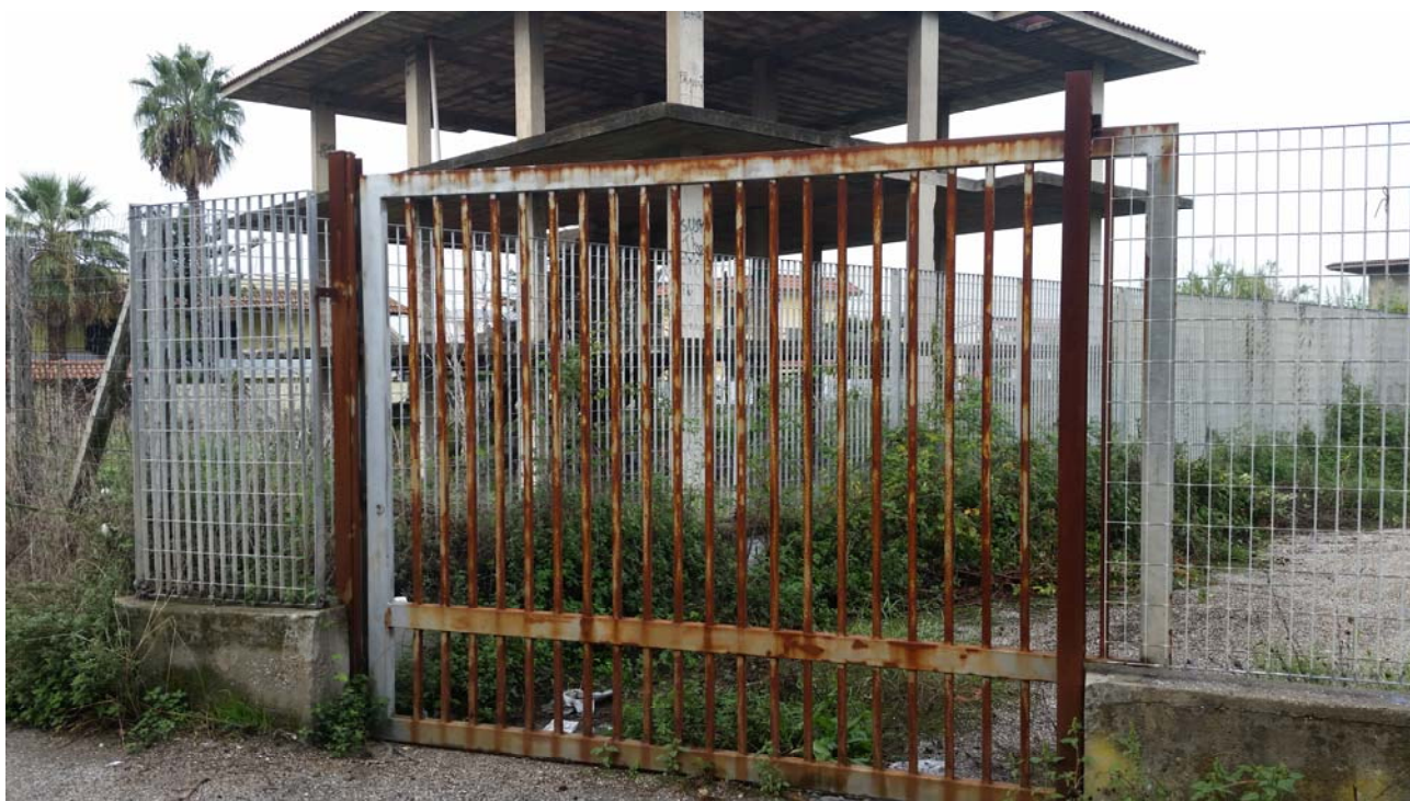
Fotografia 01 – Vista esterna

Nel presente paragrafo si riportano alcune fotografie relative all'impianto nei punti più significativi dell'impianto di sollevamento di Licola Parco Paradiso .