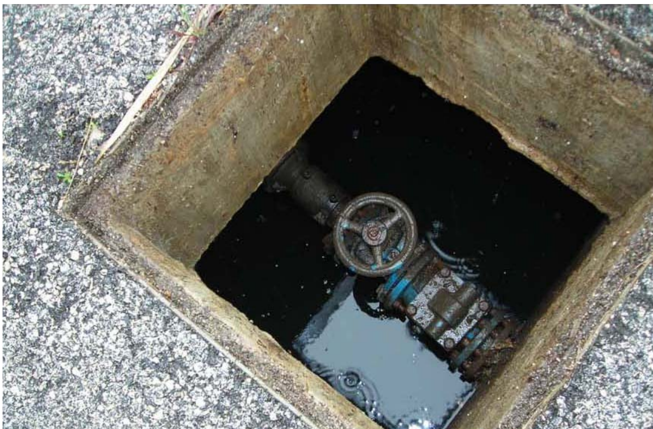
Fotografia 04 – Camera di manovra