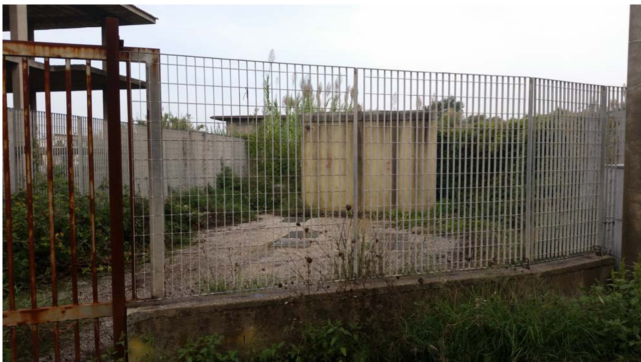
Fotografia 02 – Vista esterna