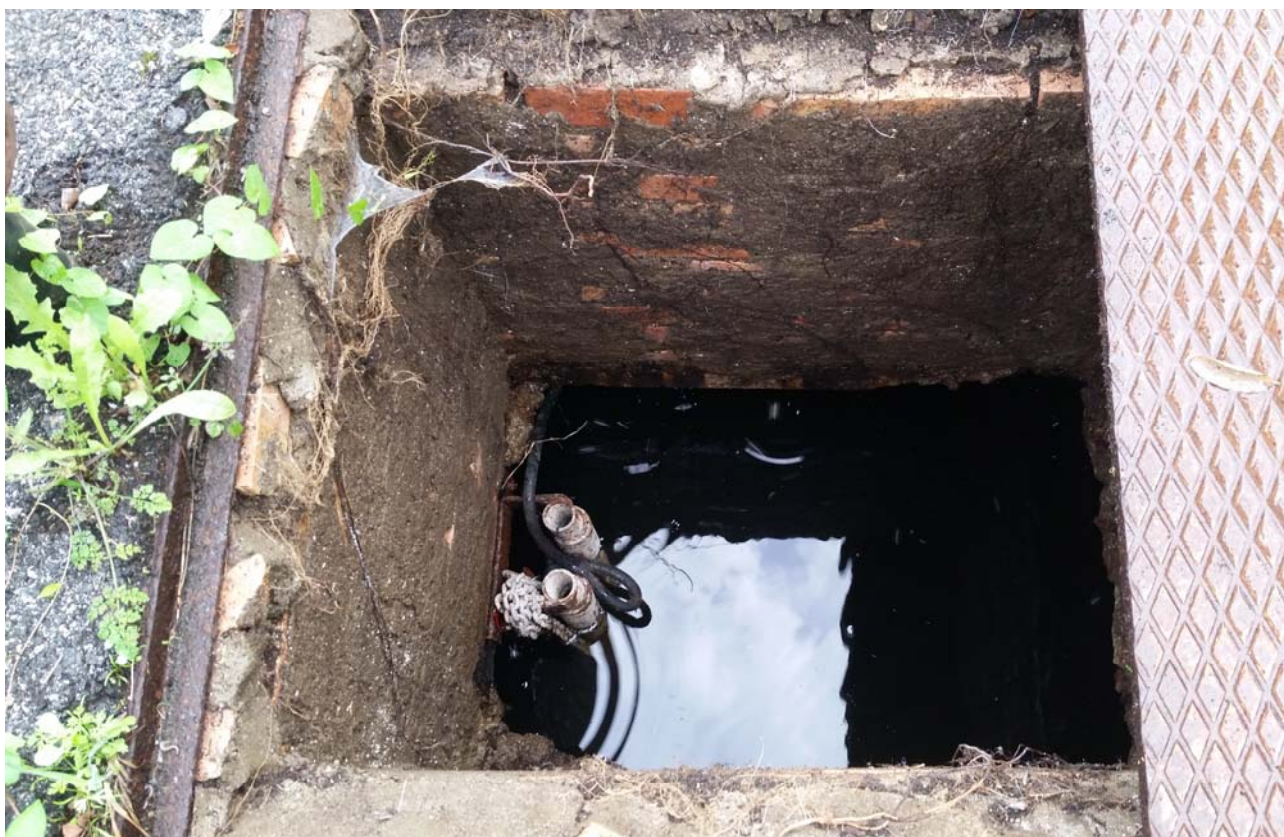
Fotografia 04 – Vasca alloggiamento elettropompe