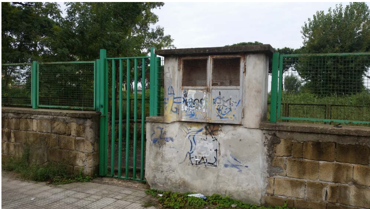
Fotografia 01 – Vista esterna

Nel presente paragrafo si riportano alcune fotografie relative all'impianto nei punti più significativi dell'impianto di sollevamento di Licola Borgo .