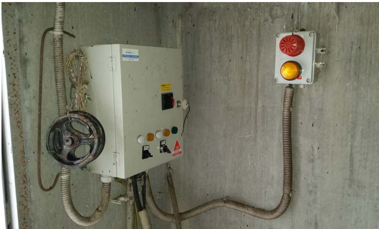
Fotografia 05 – Quadro elettrico