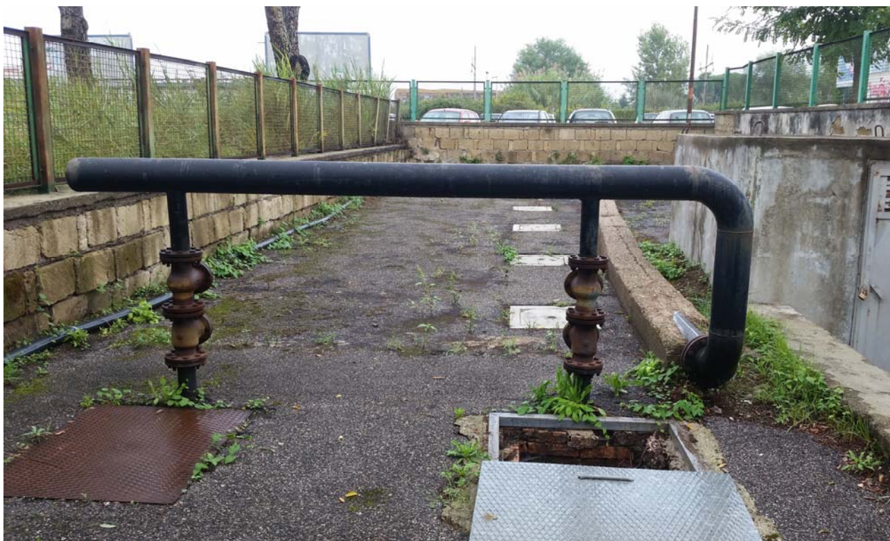
Fotografia 03 – Manovra