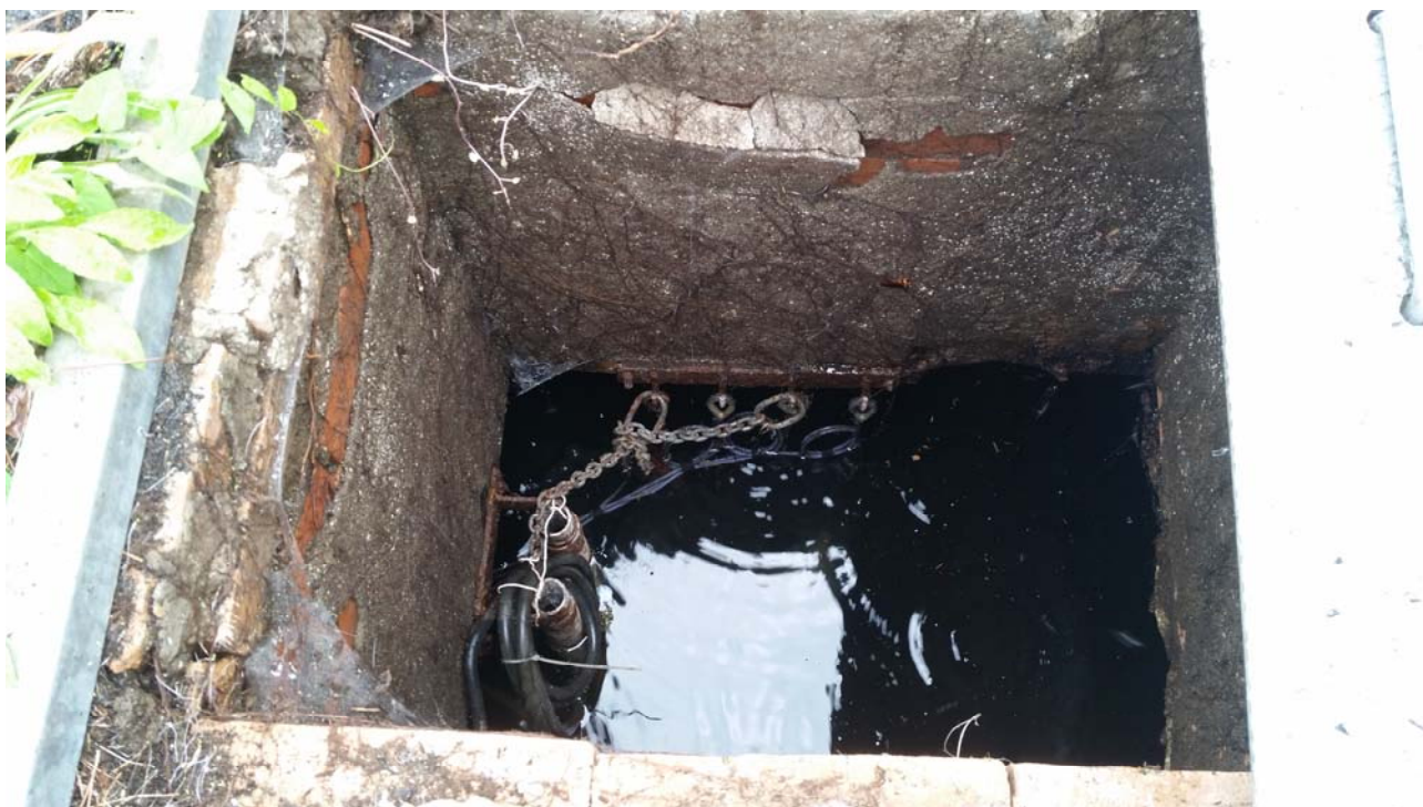
Fotografia 02 – Vasca alloggiamento elettropompe