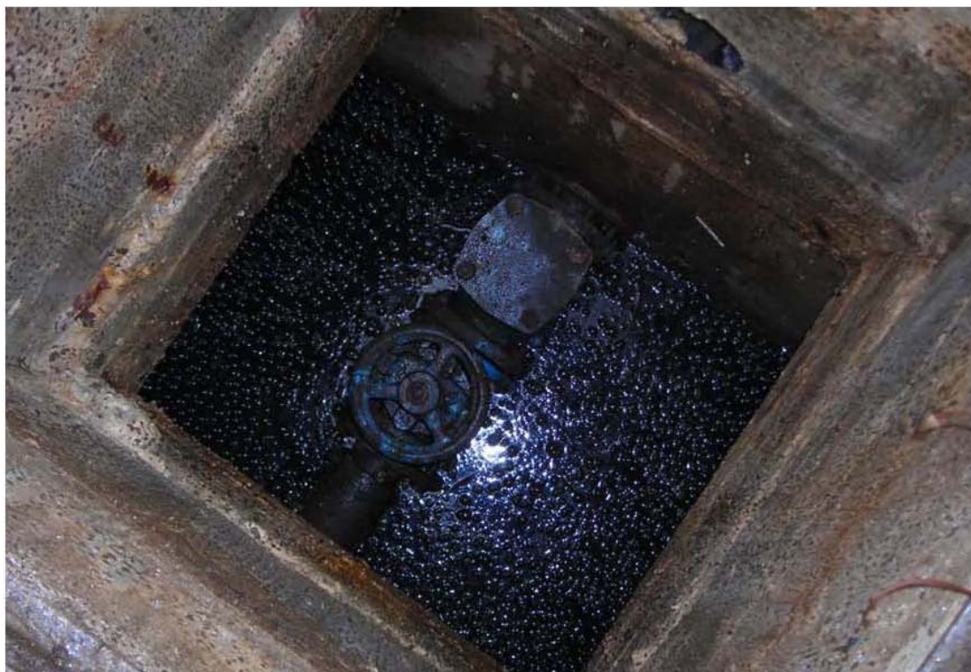
Fotografia 03 – Camera di manovra