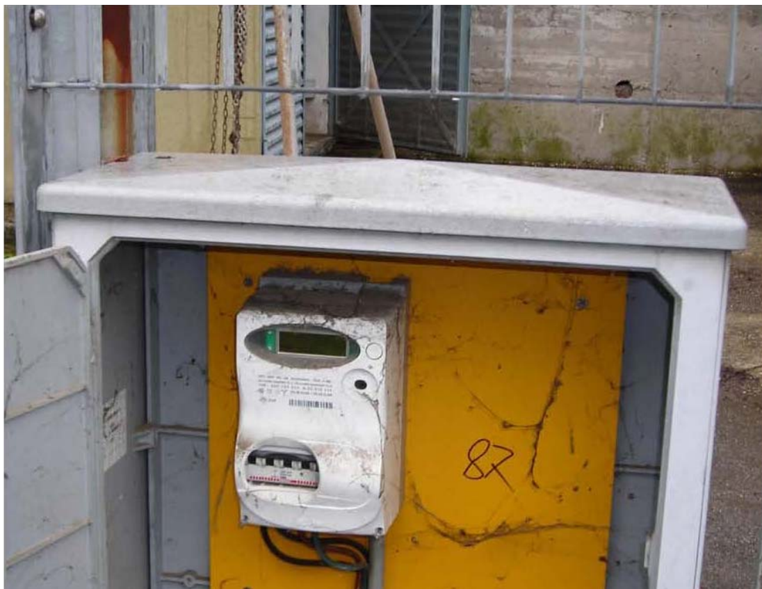
Fotografia 04 – Misuratore Enel e quadri elettrici