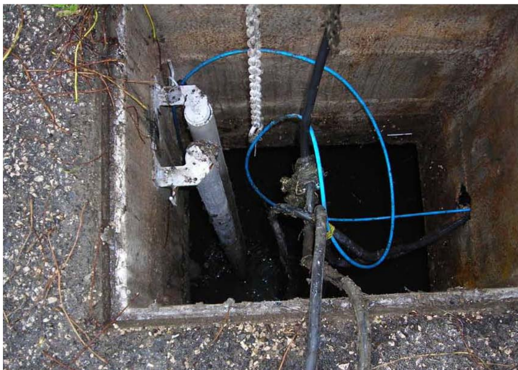
Fotografia 02 – Vasca alloggiamento elettropompe