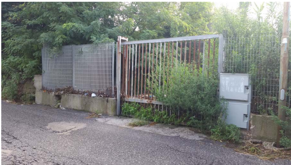
Fotografia 01 – Vista esterna

Nel presente paragrafo si riportano alcune fotografie relative all'impianto nei punti più significativi dell'impianto di sollevamento di Licola Via Cuma .